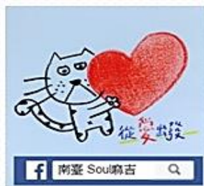
南臺 Soul 麻吉諮輔粉絲頁

FB：南臺 Soul 麻吉、IG：STUSTSOULMATCH。歡迎來按「讚」，成為麻吉一員。