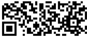
個別諮商/測驗申請表下載