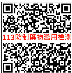
113 防制藥物濫用檢測