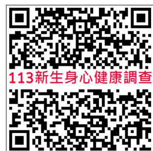
113 新生身心健康調查